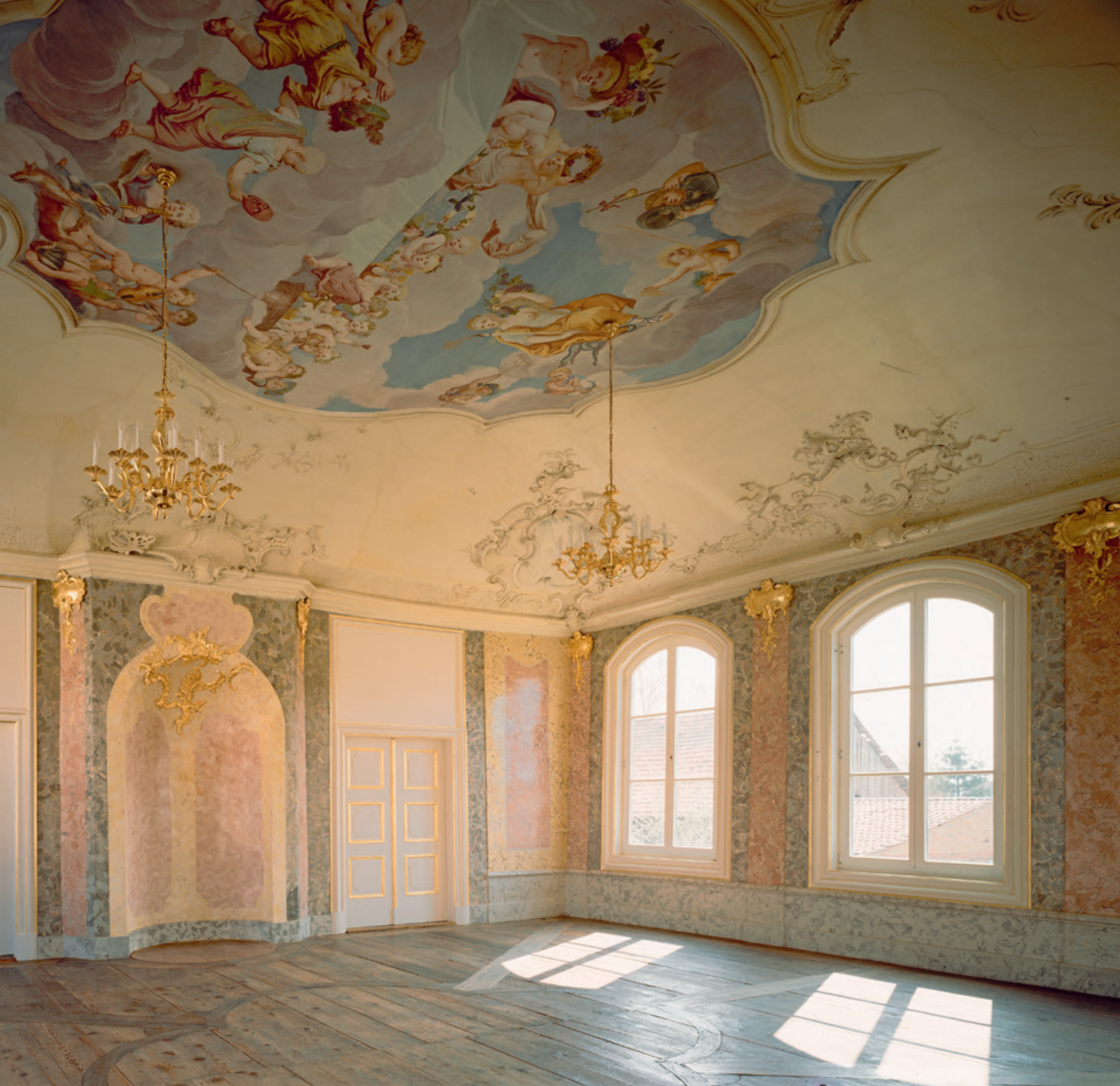
Zart hingehauchte Rocailleformen – Der glanzvolle Rokokosaal in Wechmar, dem Herkunftsort der Musikerfamilie Bach, entstand 1747.