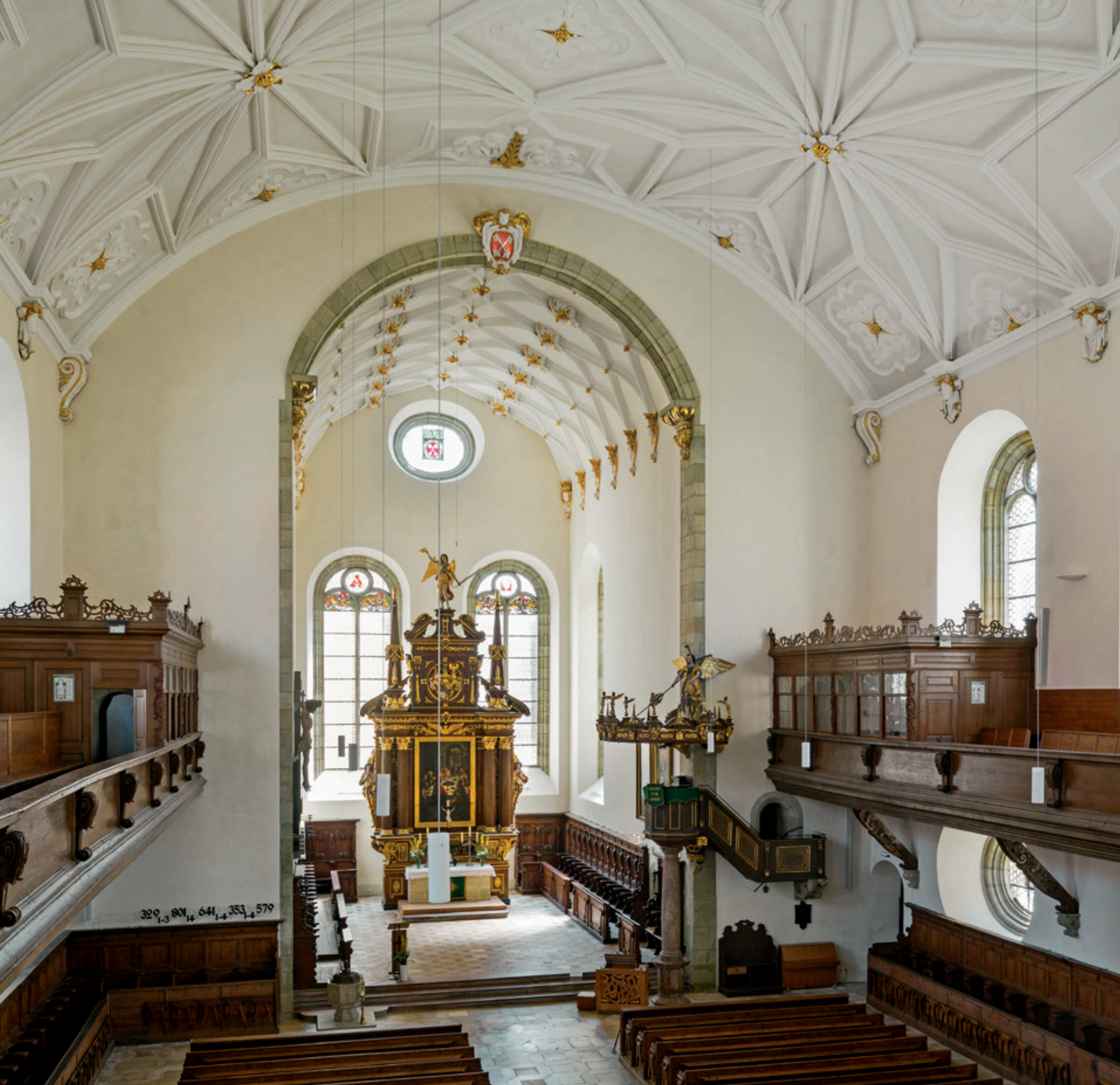
Die Dreieinigkeitskirche in Regensburg – Auftakt und Blüte des protestantischen Kirchenbaus im 17. Jahrhundert