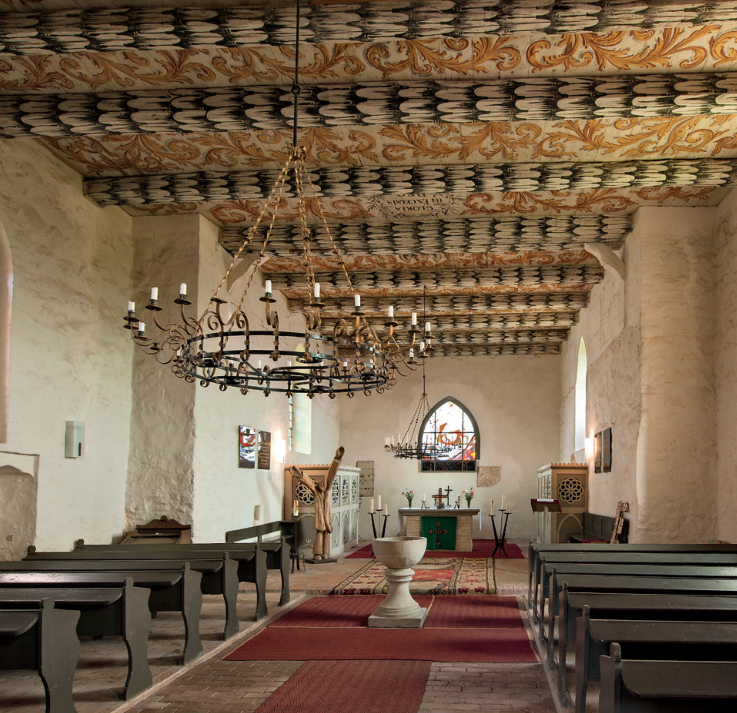
Die Dorfkirche St. Nikolai in Bauer zu Wehrland – unter der barocken Balkendecke klingen gerade die leisen Töne besonders fein.